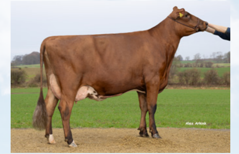
Avisto dochter Dada

dochters kalven makkelijk af en hebben zeer vast aangehechte en ondiepe uiers. Het beenwerk is wat krommer. Avisto heeft beta-caseïne A2A2.