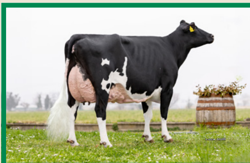
Moncleur (v. Gladius) 2e kalfs

Deze Italiaanse Gladius dochters zijn allen in hun 2e lactatie en demonstreren waarmee Gladius imponeert in heel Europa: gitzwarte, uniforme en best geuierde dochters die veel en makkelijk melk produceren. Ze doen er als 2e kalfs zelfs nog een flinke schep bovenop! In Italië is Gladius de nummer 4, in Zwitserland de nummer 3 en in Nederland is hij met 104 dochters de nummer 13 met 291 NVI en 2.529 kg melk! Met 103 uiergezondheid, 103 klauwgezondheid en 102 voor Non Return komt Gladius op 498 dagen levensduur.