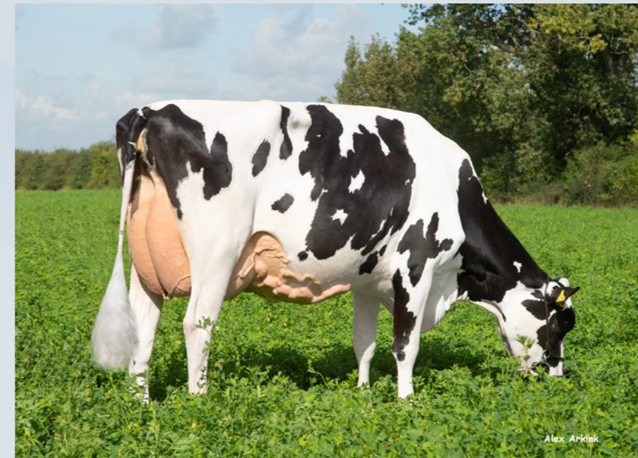
THI Xilly EX 91