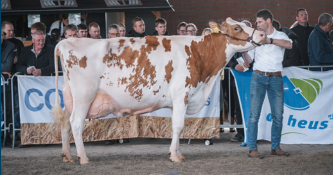
Edelweiss (v. Julandy)