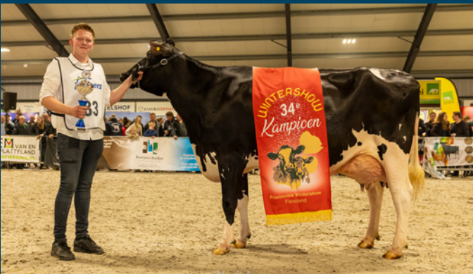
VH Iris 16 (v. Sakai)

VH Iris 16 heeft deze week de Wintershow Flevoland gewonnen. De Sakai dochter van Van Veelen Holsteins won het kampioenschap oudere koeien en kreeg van jury Ard Gunnink vervolgens ook het Algemeen Kampioenschap toebedeeld.