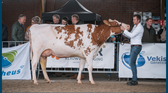
Julia 1 (v. Effektiv)

Met inmiddels 100.000 kg melk op de teller wist Julandy dochter Edelweiss voor de 2e keer op rij de Fokveeshow Lochem op haar naam te schrijven. Net als vorig jaar werd de Julandy dochter van Herbert te Selle ook dit jaar kampioene oudere koeien en won ze vervolgens het Algemeen Kampioenschap roodbont. Ook de Rendements Prijs was voor Edelweiss.