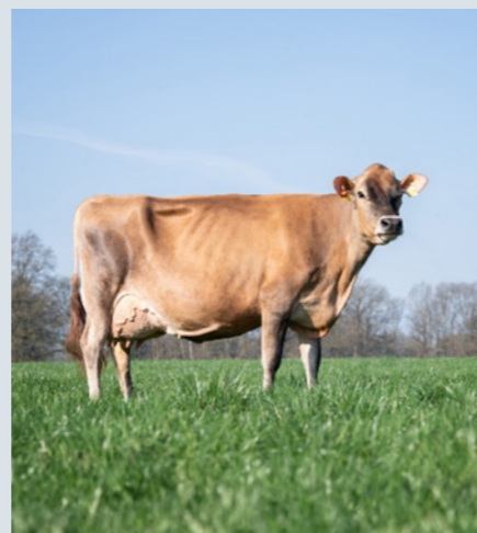
Ginger, moeder van Caesar

Ook de Jersey stier CAESAR is nieuw. Hij komt uit een dochter van Vyton x Gislev. Hij noteert in de VS +2.1 PL voor levensduur, +2.85 voor celgetal en +158 Lbs melk met +0,18 % vet en +0,05 % eiwit. Caesar heeft BB en A2A2. Beide stieren zijn ook gesekest leverbaar.