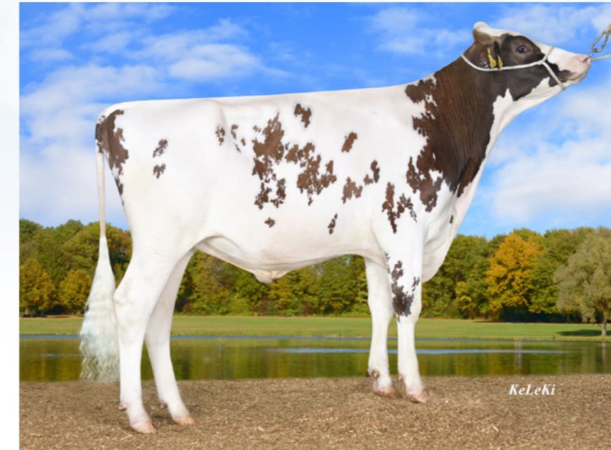
Moment PP aAa 345216

Moment PP stamt uit de Caudumer Lol familie en is een van de beste beenwerk vererfers (106 in NL, 116 in Dld.) van onze kaart. Zijn 757 dochters zijn in hun tweede lactatie en hebben zeer parallel, niet te recht beenwerk met goede klauwen waar ze zeer goed op stappen. Uit ondiepe en vast aangehechte uiers produceren ze een zeer hoog vet percentage. Niet verwonderlijk want zijn 5e kalfs moeder Lol 392 VG86 produceerde tot dusver 56.990 kg met gemiddeld 5,06% vet en 3,62% eiwit met 122 LW. Moment PP vererft daarbij een goede uiergezondheid met een zeer laag celgetal. Ook zijn levensduur, karakter en melkbaarheid zijn ruim positief. Moment PP is gecodeerd met aAa code 345216. Hij past op gesloten fijnere koeien die wat opener en sterker mogen zijn.