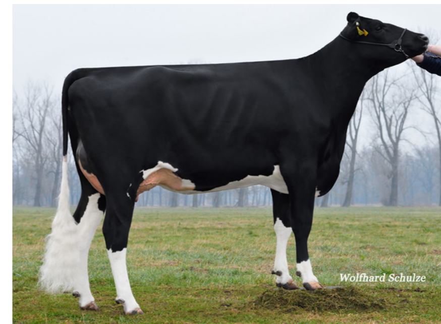
Toscana (v. Tosco)

TOSCO steeg deze draai 4 punten beenwerk in Nederland en 2 punten totaal exterieur. Met nu 106 benen, +776 kg melk met +0,40% vet en +0,05% eiwit, 102 uiergezondheid, 113 klauwgezondheid en 102 vruchtbaarheid is pinkenstier Tosco een beste allrounder.