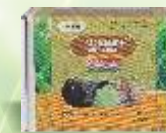
Tracesure® Cu/I Calf

Een unieke reeks van leaching bolussen die optimale, langdurige aanvulling van de essentiële sporelementen afgeven met één toediening