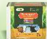
Tracesure® Cu/I Cattle